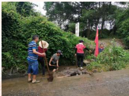
桂北农场公司开展“清除杂草,保道路畅通”主题党日活动