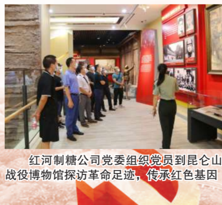
红河制糖公司党委组织党员到昆仑山战役博物馆探访革命足迹,传承红色基因