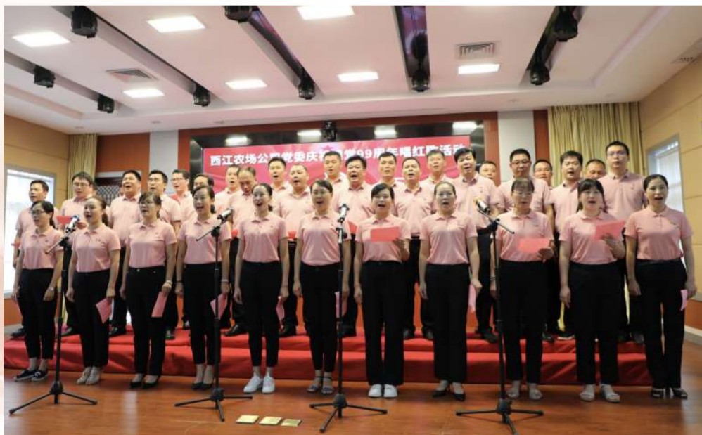
西江农场公司举办唱红歌活动

走访慰问老党员和困难党员、表彰先进、召开纪念大会、开展主题党日活动、重温入党誓词、专题学习、观看纪录片……今年是中国共产党建党99周年。为庆祝党的生日,垦区企业举办了形式多样的庆祝活动。(垦区通讯员供图)