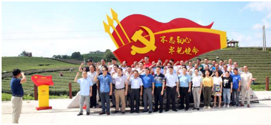
良圻农场公司在万古茶园开展党建交流活动,重温入党誓词